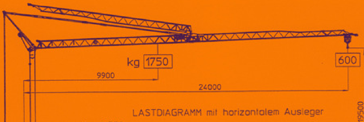
LASTDIAGRAMM mit horizontalem Ausleger